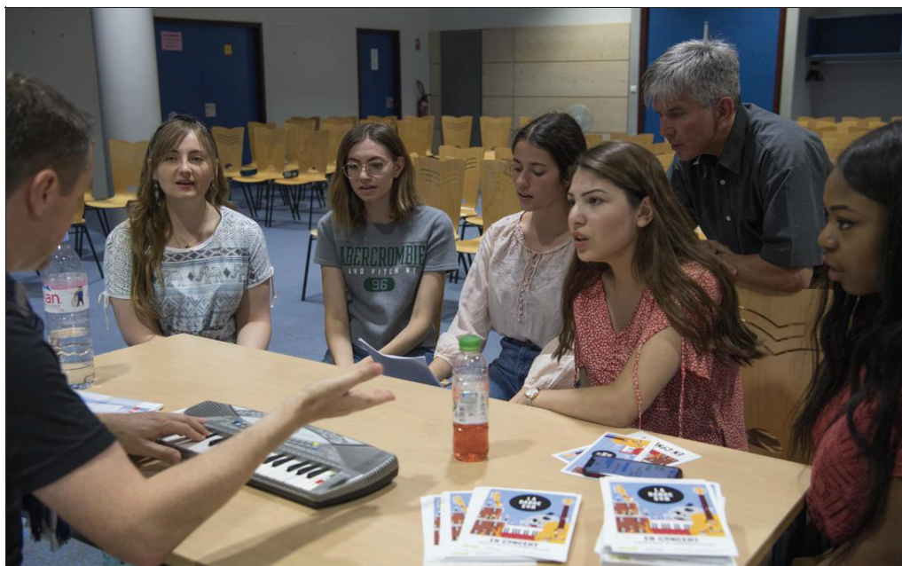
La Bande Son en répétition pour préparer leur passage place Kléber.